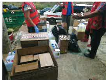
Priprema i dostava zaštitne opreme za ustanove SDŽ

Osnovna sredstva u vlasništvu Crvenog križa Solin: